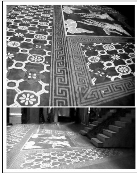
Gambar 3. Pola lantai