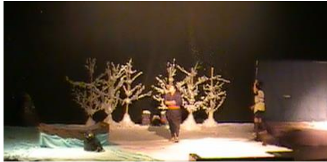
Gambar 5. Setting ruang "Yuki Onna"

Tata ruang yang bersifat realis bersifat detail atau mengalami penyederhanaan yang tetap membentuk sifat realisnya; yang diungkapkan secara spesifik, stilasi, esensi, atau lainnya. Dalam ruang yang realis, sifatnya adalah penciptaan visual pada kehidupan sehari-hari; sebuah peristiwa yang nyata, berhubungan langsung dengan kehidupan dan pernah terjadi atau mungkin terjadi.