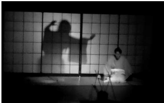
Gambar 12. Warna dan bayangan cahaya "Yuki Onna"

Penciptaan ilusi lewat cahaya juga dibutuhkan dalam teater realis, dan hal ini dikaitkan dengan bentuk dan bayangan yang hadir melalui penggunaan warna, material dan tata cahayanya. Warna cahaya menciptakan kejelasan karakter pada objek ataupun atmosfer pada ruangnya. Contohnya pada karya "Yuki Onna" ini, warna serta bayangan diterapkan dengan tepat sehingga mencapai suasana yang mudah dimaknai. Ruang dengan warna hangat bergeser menjadi warna merah pekat pada latar dengan efek bayangan menjadi latar yang menyatu dengan ruang depannya yang berwarna biru, sisi kontrasannya menjadi kekuatan tanda dalam pencapaian perasaan dan sensasi adegan.