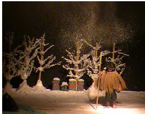
Gambar 8. Ruang dan tata cahaya “Yuki Onna”

Alur cerita pada naskah realis harus dipenuhi dengan penerapan cahaya yang menguatkan kejelasan ruang setting nya. Pencahayaan memiliki dua prinsip warna yang melibatkan warna cool dan warm ( color gel -warna dalam pencahayaan), yakni berperan sebagai penanda setting waktu, peristiwa dan kejadian; serta menggambarkan musim atau suasana tertentu lainnya. Contohnya, pada karya “Yuki Onna” (gambar 8), dinginnya musim salju diusahakan melalui kuat terang dan warna pencahayaan yang tepat bersamaan dengan material yang saling mendukung.