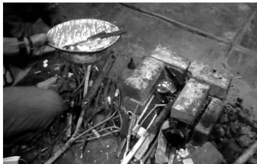
Gambar 10. Perapian, kesan api melalui cahaya

Pada bagian perapian, agar tampak nyata, maka dibuatlah suatu rakitan modifikasi menggunakan lampu neon dan filter yang kemudian dinyalakan secara manual sehingga menciptakan kesan “api” (gambar 10). Lampu teplok atau lampu minyak yang menjadi ciri tanda penerangan rumah di pedesaan digunakan untuk menguatkan kesan realisnya.