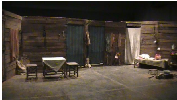
Gambar 6. Setting ruang realis "Lithuania" (SAC)

batasan tersebut, namun dalam pemeranan adegannya dapat diketahui bahwa di balik pintu masuk tersebut adalah sebuah latar hutan, yang juga didukung oleh tata suara yang menjelaskan tempat dan waktu kejadiannya. Perabotan yang ada menunjuk pada fungsi sebenarnya, misalnya kursi dan meja menjadi area makan ataupun area duduk. Setting dapur dan perlengkapannya disajikan secara detail untuk pencapaian kesan yang mudah ditangkap dan dihayati oleh penonton. Jarak antara perabot dengan elemen lainnya disusun dengan keserasiannya dalam alur adegan, sehingga terciptalah sebuah ruang dan waktu yang sangat dekat dengan penontonnya.