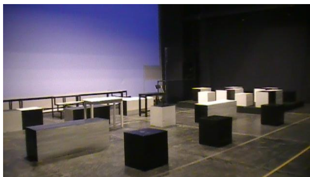
Gambar 7. Setting ruang "Visa"

Dalam karya "Visa" (Teater Satu) yang disutradarai oleh Iswadi Pratama, merupakan sebuah karya dengan naskah dan pemeranan yang realistis yang diwujudkan melalui panggung yang non-realistis. Pemakaian bentuk setting ruang yang ditampilkan bersifat tegas, tanpa adanya penggunaan garis lengkung serta dengan penggunaan warna hitam dan putih. Warna ini memberi pengertian adanya ketegasan antara 'ya' dan 'tidak' dalam suasana yang kacau di kedutaan untuk permohonan visa. Latar dengan warna biru dan kuning memenuhi ruang, tanpa bingkai ataupun ornamen, serta kotak hitam putih yang menjadi tanda tempat duduk dikomposisikan sedemikian rupa, dapat menciptakan ruang dengan suasana yang seimbang dan tidak datar. Komposisi tata panggungnya mengalami penyederhanaan dan dibuat seolah-olah menjadi batasan-batasan yang ada pada ruang permohonan visa secara nyata.