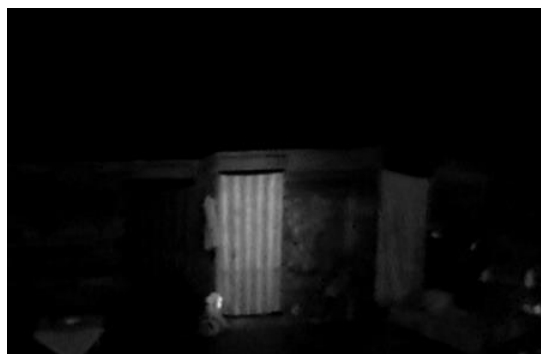
Gambar 11. Tata cahaya “Lithuania”

Cahaya memiliki hubungan yang sangat solid dengan ruang dengan “kesetiaan” dalam hal blocking dan penempatan bukan hanya soal komposisi. Tata cahaya harus diatur agar penyebarannya tidak keluar batas ruang yang telah ditentukan. Teknik batasan cahaya dapat digunakan untuk menandakan kejelasan batasan ruang adegan (gambar 11), contohnya sebuah pintu diterangi oleh kuat cahaya dengan tegas tanpa keluar batas dari ukurannya sehingga menambah kejelasan dalam pengekspresian ruang peristiwanya.