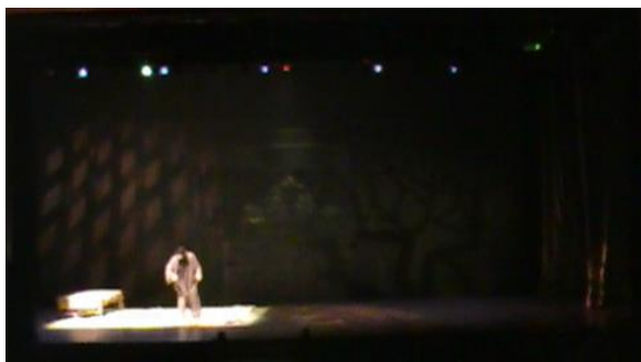
Gambar 13. Ruang dan tata cahaya "Sie Jin Kwie Kena Fitnah"

Contoh lain pada karya "Sie Jin Kwie Kena Fitnah", latar belakang cerita ditampilkan dengan unsur warna cahaya yang terlihat dominan yakni warna kuning dan oranye yang merupakan warna identik konsep Cina, dengan maksud agar material dengan warna emas pada elemen ruangnya terlihat jelas pada saat penataannya. Intensitas cahaya yang menyorot kuat pada bagian aktor serta bayangan yang muncul pada latar, menjadi tanda ruang dan waktu peristiwanya, mengekspresikan realita yang ada.