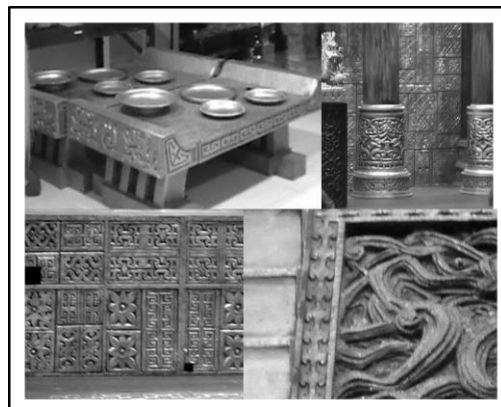
Gambar 4. Elemen dekoratif

Contoh lain, dalam karya “Yuki Onna” yang dipentaskan oleh mahasiswa Sastra Jepang Universitas Kristen Maranatha, terdapat permasalahan komunikasi karena karya ini disampaikan dalam bahasa Jepang dan tidak seluruh penontonnya mengerti bahasa tersebut, sehingga membutuhkan adanya setting ruang yang tepat untuk membantu dalam penyampaian pesannya.