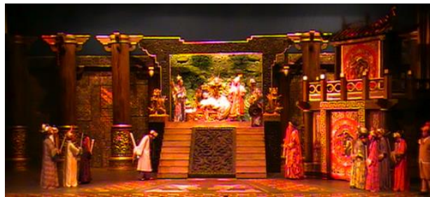
Gambar 1. Setting ruang "Sie Jin Kwie Kena Fitnah"

dengan konsep Cina pada zaman Dinasti Tang (gambar 1), serta material dan warna lainnya yang mendukung pengekspresian konsepnya.