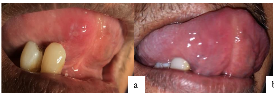
Gambar 3. Gambaran klinis pasien pada saat kontrol 1 minggu (a); kontrol 1 bulan (b)

Pada saat kontrol 1 minggu pasien merasa sariawan sudah tidak sakit, namun lesi tersebut masih menunjukkan proses penyembuhan. Perbaikan lesi terlihat pada saat pasien kontrol kunjungan 1 bulan (Gambar 2).