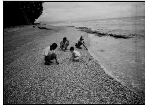
Gambar 1. Batu api di sekitar pesisir pantai Masohi-Maluku Tengah

Batu api ini sering dipakai dalam pembangunan di daerah Masohi - Maluku Tengah. Selain banyak ditemukan, batu api juga ternyata mempunyai kandungan mineral yaitu mineral kuarsa yang membuat batu ini lebih kuat dibandingkan dengan agregat kasar lain. Untuk itu batu api sangat baik digunakan dalam campuran beton.