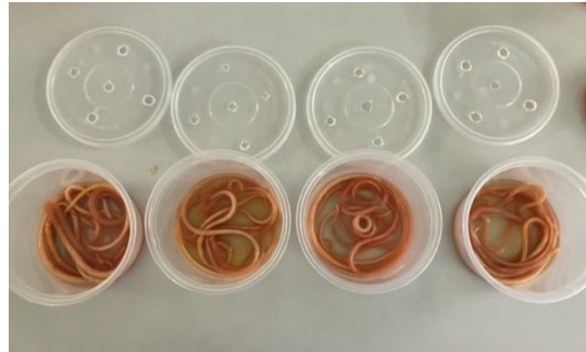
Gambar 1 Pengujian Efek Antelmintik

Hasil penelitian dari pemberian ekstrak bawang merah ( A. cepa L. Var. aggregatum ) dengan konsentrasi 6%, 9%, dan 12% terhadap 5 cacing A. suum pada setiap percobaan adalah sebagai berikut (Gambar 1, Tabel 2).