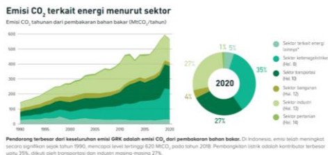
Gambar 2 Emisi CO 2 Tahunan Terkait Energi Menurut Sektor

oleh Climate Transparency , dari keseluruhan emisi GRK di Indonesia yang menyumbang lebih besar berasal dari emisi CO 2 yaitu pembakaran bahan bakar fosil. Berikut di bawah ini merupakan grafik emisi CO 2 tahunan di Indonesia pada Gambar 2.