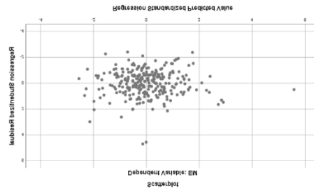
Gambar 2 Grafik Scatter Plot

Berikut ini disajikan gambar hasil SPSS 25.00 untuk menguji heteroskedastisitas: